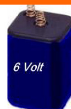
6 Volt Blockbatterien Zink/Kohle